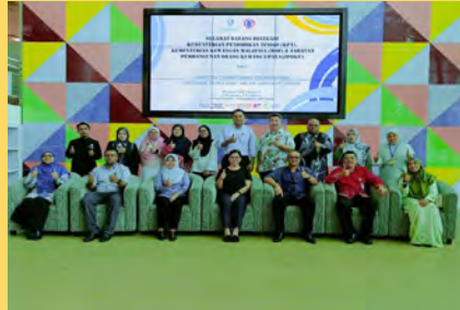
Universiti menerima kunjungan daripada delegasi Kementerian Pendidikan Tinggi (KPT), Kementerian Kewangan Malaysia dan Jabatan Kebajikan Masyarakat (JKM).