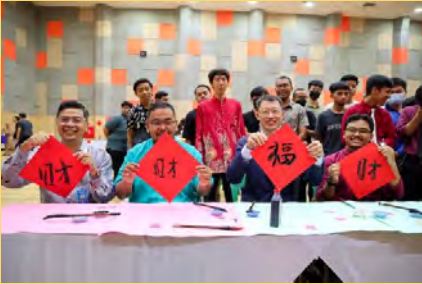
Universiti menganjurkan program Chinese New Year Cultural 2023.