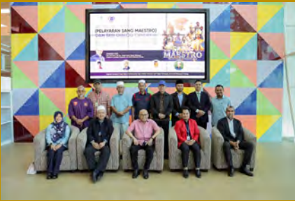
Universiti menganjurkan program Tayangan Khas Dokumentari (Pelayaran Sang Maestro) dan Sesi Dialog Cendekia.