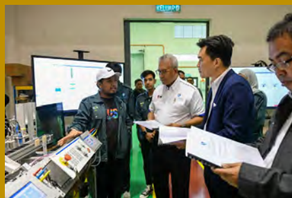
Universiti memeterai kerjasama dengan Bosch Rexroth Sdn. Bhd. (Bosch Rexroth).