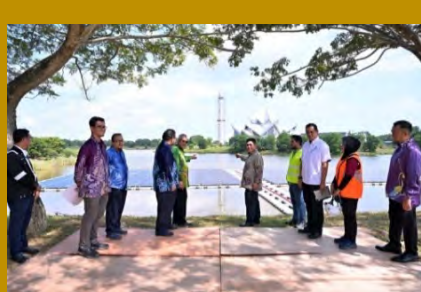
UMPSA miliki panel solar terapung yang terdiri daripada 240 unit panel, 1 unit inverter 125 Amp dan lebih daripada 136 unit pelampung bagi membentuk kawasan seluas 2,574 meter persegi.