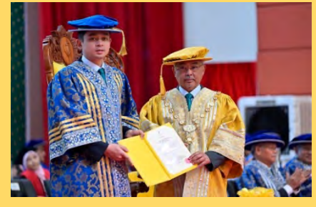
Kebawah Duli Yang Maha Mulia Pemangku Raja Pahang Tengku Mahkota Tengku Hassanal Ibrahim Alam Shah ibni Al-Sultan Abdullah Ri'ayatuddin Al-Mustafa Billah Shah dimasyhurkan sebagai Pro-Canselor UMPSA pada Majlis Konvokesyen Ke-18.