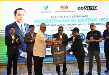
Dua bas elektrik dan dua van elektrik dengan stesen pengisian EV diperkenalkan di UMPSA bagi menggalakkan penggunaan karbon rendah serta kenderaan pintar yang cekap tenaga.