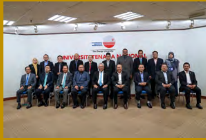
Kunjungan delegasi UMPSA ke Universiti Tenaga Nasional (UNITEN).