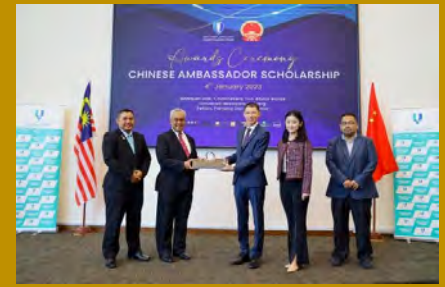
Seramai 47 pelajar Program Ijazah Dual dan Beijing Jiaotong University (BJTU) China yang bakal menyambung pengajian di BJTU.