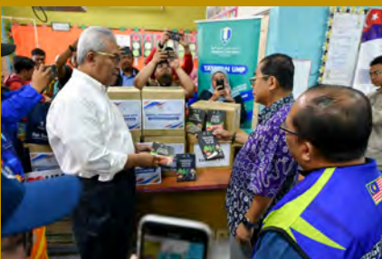
Universiti menggerakkan Misi Sukarelawan Banjir Selatan di Kampung Teluk Hutan Lesung, Tanjung Sedili, Kota Tinggi.