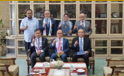
UMPSA dilantik sebagai Sekretariat Majlis Penasihat Ekonomi Negeri Pahang (MPEN).