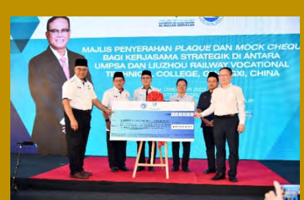
UMPSA menubuhkan Pusat Latihan Rel hasil kolaborasi dengan Liuzhou Railway Vocational Technical College (LZRVT) dalam memperkasa bidang kejuruteraan dan teknologi rel yang menyokong Agenda Pemerkasaan TVET Negara.