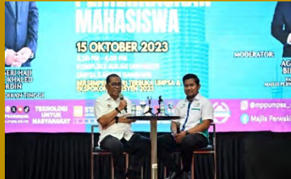
Menteri Pendidikan Tinggi, Yang Berhormat Dato' Seri Mohamed Khaled Nordin hadir merasmikan Hari Terbuka dan Expo Konvokesyen 2023 UMPSA serta menjayakan Forum Bicara Madani: Mahasiswa Tonggak Negara Madani.