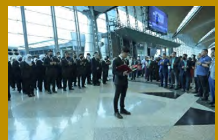
Seramai 45 orang pelajar Program Ijazah Dual UMP dan Beijing Jiaotong University (BJTU), China berlepas ke China bagi menyambung pengajian selama dua tahun.