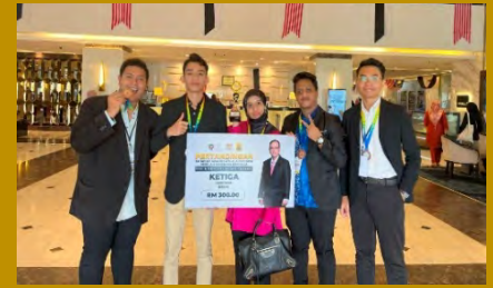
UMPSA Tempat Ke-3 Pertandingan Bahas Bahasa Melayu Ala Parlimen Piala Menteri Besar Pahang 2023.