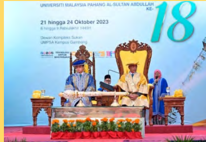
Kebawah Duli Yang Maha Mulia Seri Paduka Baginda Yang di-Pertuan Agong Al-Sultan Abdullah Ri'ayatuddin Al-Mustafa Billah Shah ibni Almarhum Sultan Haji Ahmad Shah Al-Musta'in Billah, Tuanku Canselor UMPSA berangkat menyempurnakan Istiadat Pemasyhuran UMPSA pada Majlis Konvokesyen UMPSA Ke-18.