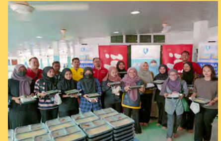
Lebih 500 pelajar menikmati juadah makan tengah hari yang lazat secara percuma sempena Program Jelajah Kenduri Rawang Adabi bersama pelajar bertempat di Masjid Universiti.