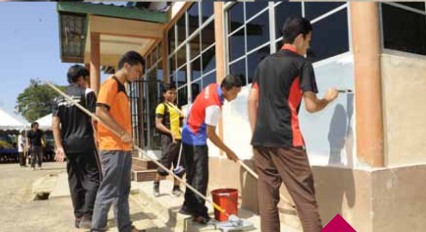
GOTONG-ROYONG.... Sukarelawan UMP mengecat bangunan yang terjejas akibat banjir.