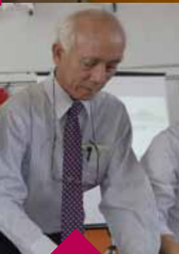
SENI.... Sebahagian aktiviti yang dijalankan sempena Minggu Kebudayaan Tahun Baharu Cina 2015 di UMP Kampus Gambang.