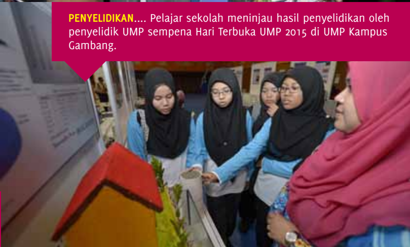
PENYELIDIKAN.... Pelajar sekolah meninjau hasil penyelidikan oleh penyelidik UMP sempena Hari Terbuka UMP 2015 di UMP Kampus Gambang.