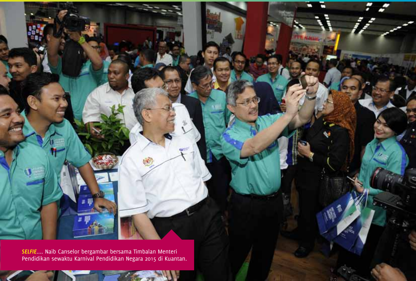
SELFIE.... Naib Canselor bergambar bersama Timbalan Menteri Pendidikan sewaktu Karnival Pendidikan Negara 2015 di Kuantan.