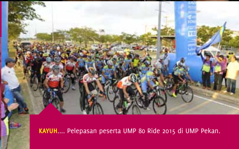
KAYUH.... Pelepasan peserta UMP 80 Ride 2015 di UMP Pekan.