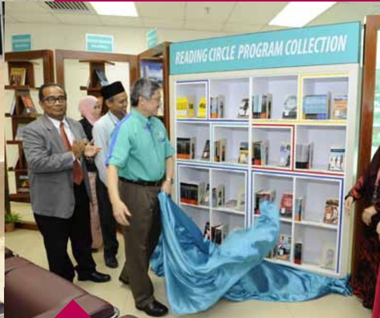
RASMI.... Naib Canselor merasmikan Reading Circle Program di Perpustakaan UMP Pekan.