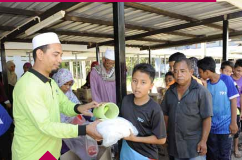
SUMBANGAN.... PIMPIM memberikan sumbangan kepada mangsa banjir di Kampung Sekara, Maran.