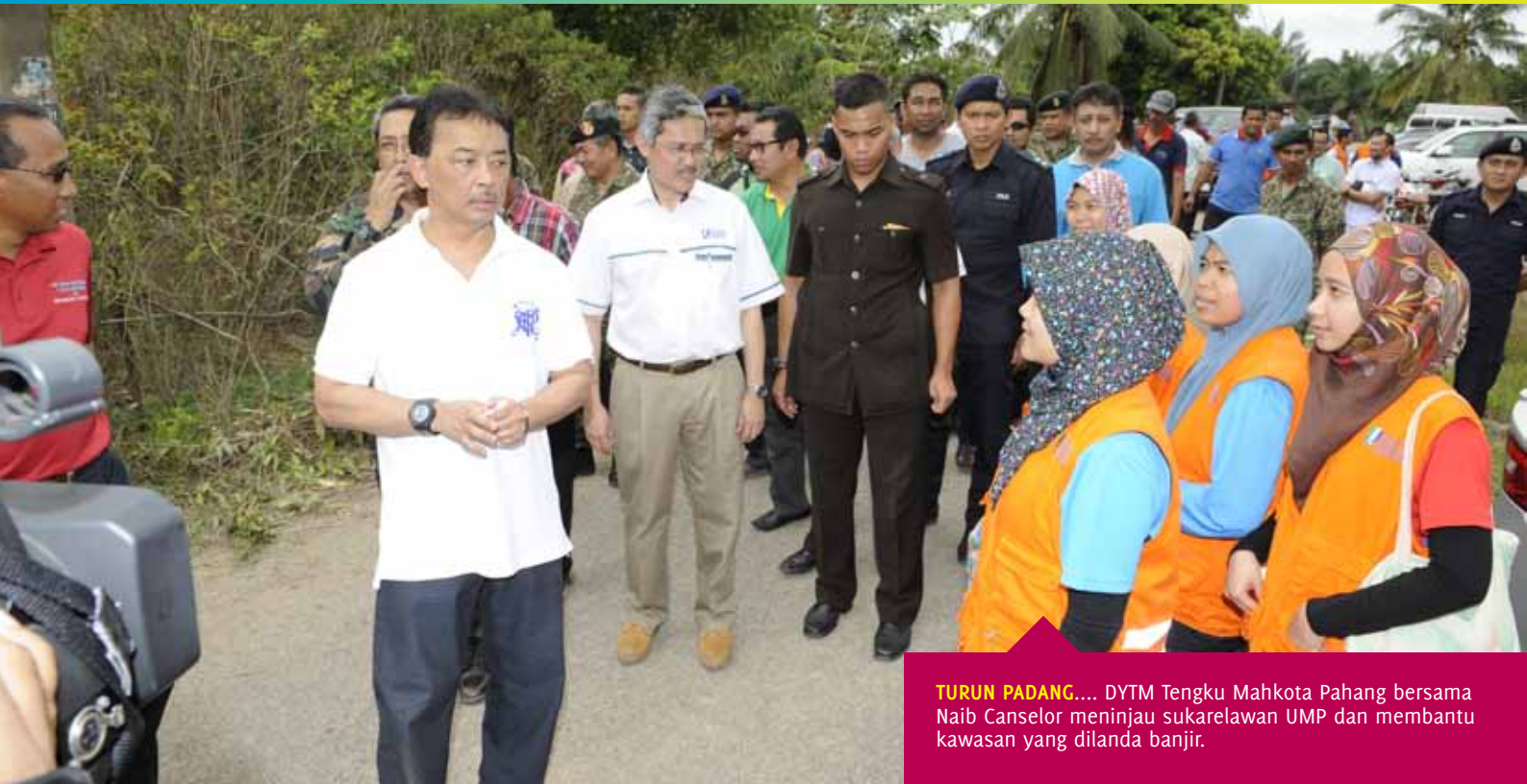
TURUN PADANG.... DYTm Tengku Mahkota Pahang bersama Naib Canselor meninjau sukarelawan UMP dan membantu kawasan yang dilanda banjir.